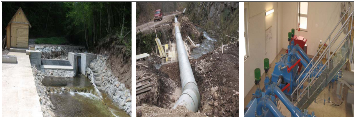
Slika 2. Prikaz realizacije građevinskih i montažnih radova na MHE R-S-1 Figure 2 Presentation of realization of construction and assembling activities on SHPP R-S-1